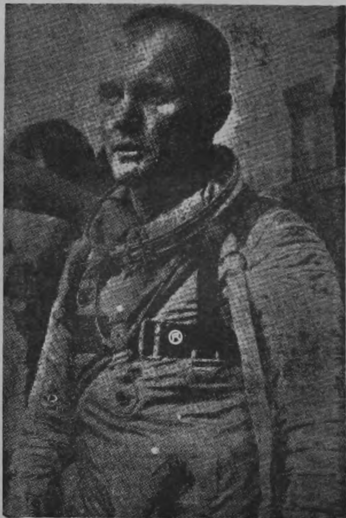
Ahora se conocen las dificultades que tuvo Cooper

Gordon Leroy Cooper tiene 36 años, mide un metro setenta y seis centímetros de altura y al comenzar su aventura espacial pesaba 66 kilos. Al bajar del espacio, después de haber recorrido en 34 horas y 20 minutos, 980 mil kilómetros a la velocidad orbital de 28.000 kilómetros por hora, había perdido tres kilos y 150 gramos. ¿Por qué?