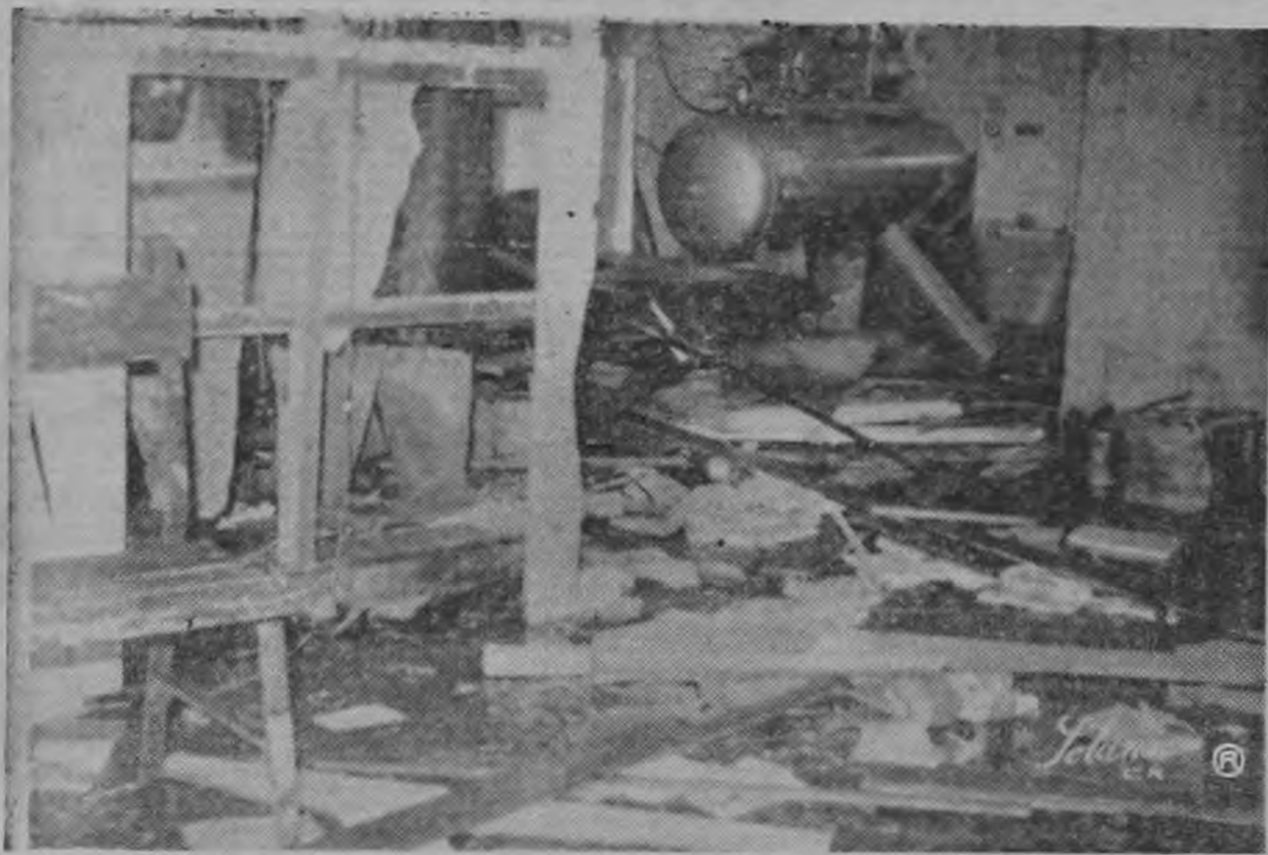
DOS PERSONAS QUEDARON HERIDAS en el estallido ocurrido anoche en el garage de la Compañía de Fuerza y Luz en los alrededores de la Estación del Atlántico. La foto da una idea de los daños que se produjeron. Las causas de la explosión eran desconocidas anoche.