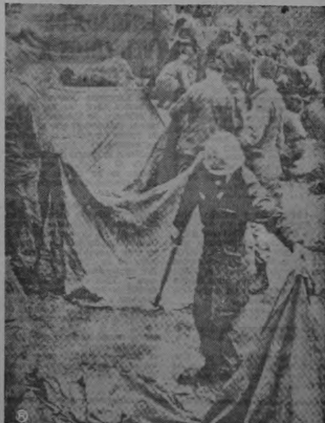
MIEMBROS DE LA SEGUNDA DIVISION aerotransportada de Texas a Alemania Occidental plantan sus tiendas en el bosque de Landstuhl. Después de las maniobras serán llevados nuevamente a Texas. Estas maniobras costarán a Estados Unidos 20 millones de dólares.