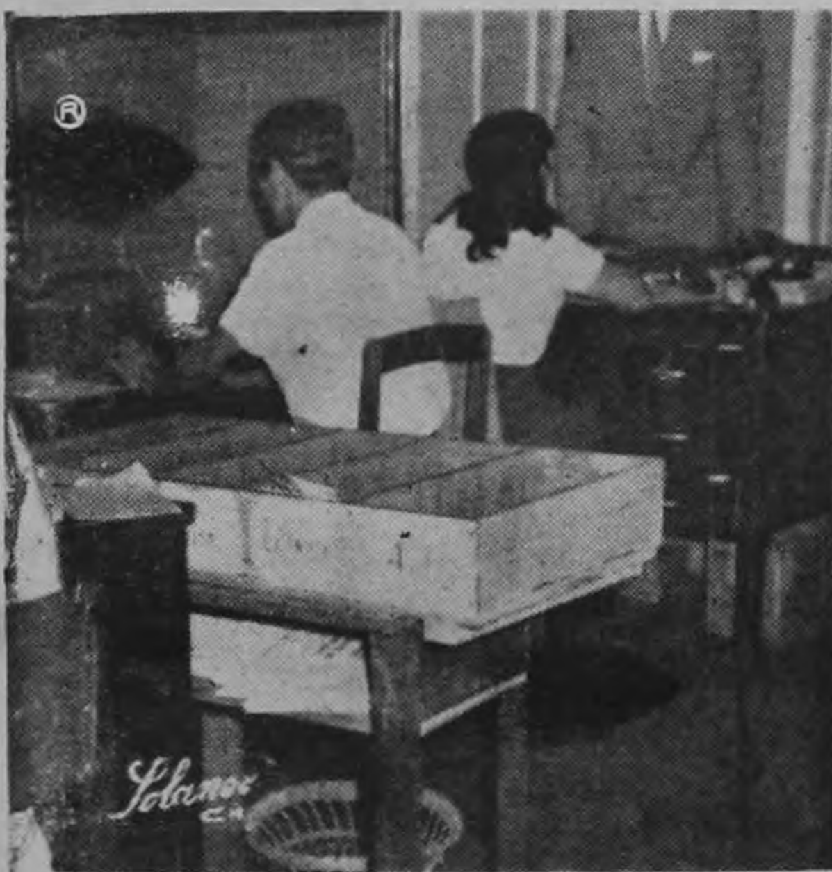
EN LA CAJA que vemos en primer plano se van acumulando los asuntos para el despacho. El mueble no puede ser más rústico.

Ayer en horas de la tarde "La República" envió sus reporteros a las Oficinas del Director de Migración, Mayor Hernán Solano, con el fin de recabar una más amplia información con respecto a ciertas dificultades que se vienen confrontando en ese Departamento y que recogieramos en reciente comentario editorial.