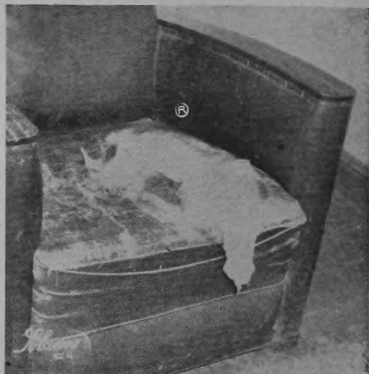
ESTE ES UNO DE LOS SILONES de la antesala que da al despacho del Director de Migración. Su estado no puede ser más deplorable. Ya está para el retiro.